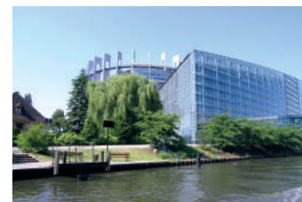
Parlement européen, Strasbourg

Si vous n'avez pas la possibilité de vous déplacer, vous pouvez avoir recours au vote par procuration. Tout électeur ou toute électrice qui est inscrit-e dans une commune française peut alors vous représenter. Même si la démarche pour la procuration peut se faire jusqu'au jour du vote, il est conseillé d'engager la démarche de la procuration le plus tôt possible, à cause des délais d'acheminement et de traitement par votre Mairie de vote.