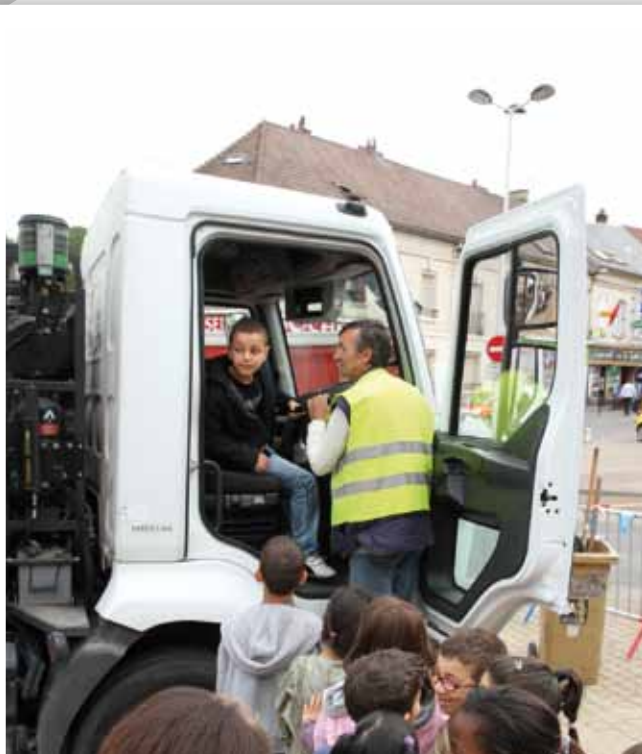
19 juin Belle participation des écoles de Montataire pour la journée de la propreté.