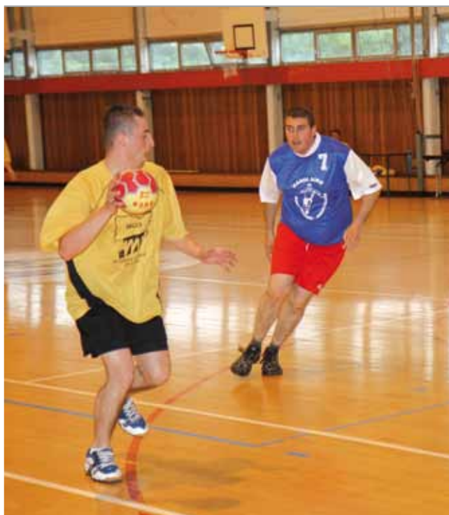
19 au 23 juin Les journées de l'OMS dans la salle Marcel Coene.