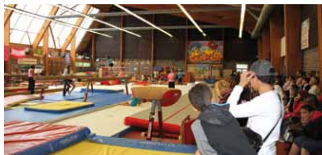
24 juin Fête de la gym à la salle Marcel Bouchoux.