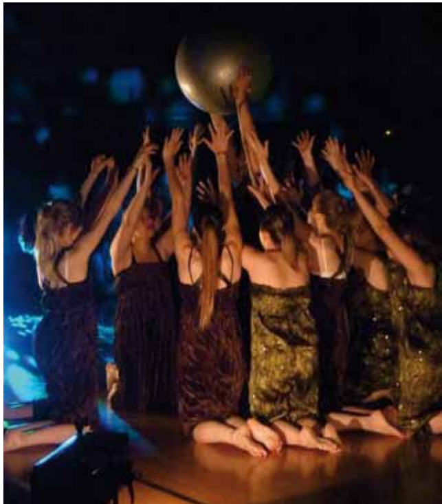
23 juin Salle comble à la salle Marcel Coene pour le spectacle du Modern' Jazz.