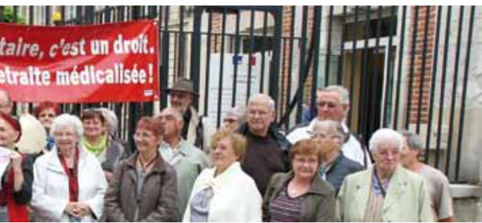
projet d'Éhpad à Montataire.