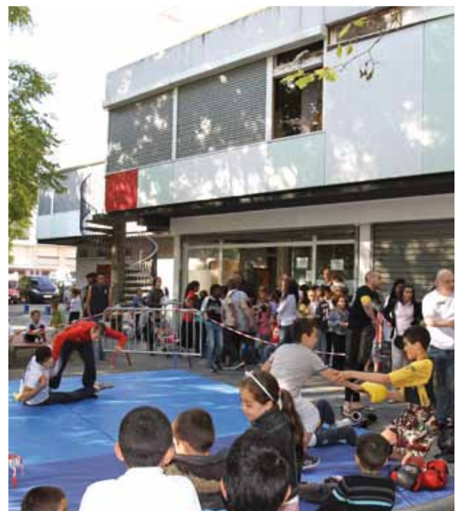
22 juin Inauguration de l'Espace Huberte d'Hoker