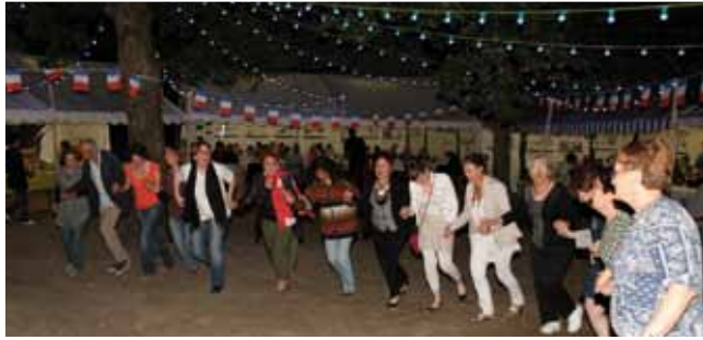
29 juin Grand banquet républicain au parc du petit château, dans le cadre de l'année Rousseau.