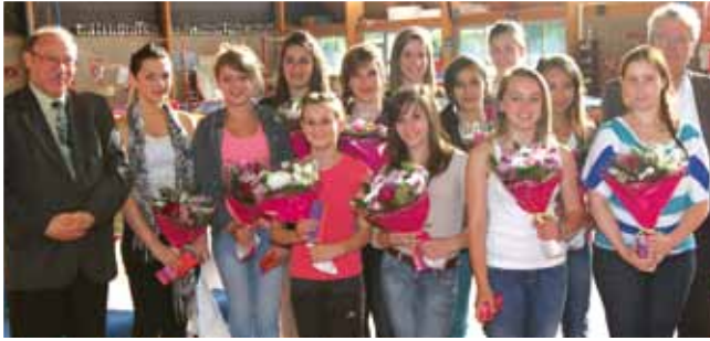
6 juin Cérémonie de remerciements aux championnes de France de Team Gym.