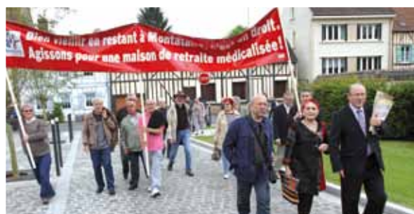
Délégation au Conseil Général

Alors ? Sans attendre, continuer la mobilisation et se faire entendre : que le CG et l'ARS lancent les appels à projet pour la dignité des anciens, que l'ensemble des acteurs se retrouvent autour d'une table pour trouver les solutions humaines à la dépendance et à la vieillesse. ■