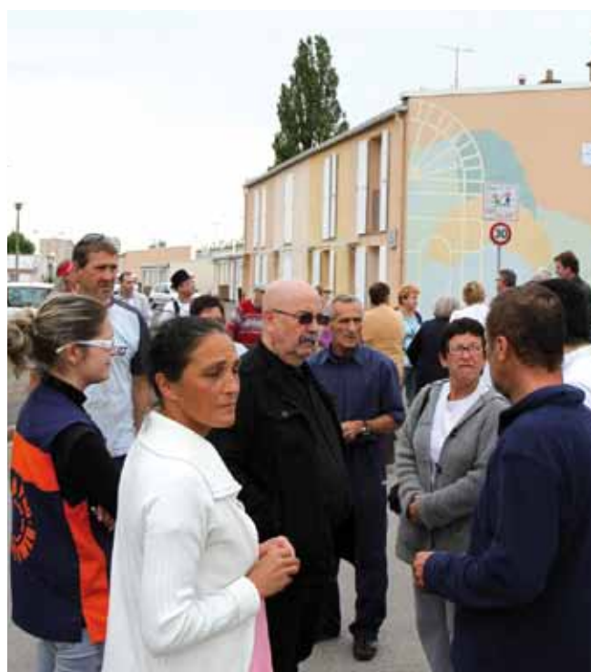
19 juin Groupe de travail du Plan de rénovation urbain avec la restructuration de la rue des champs.