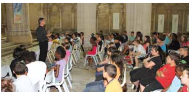
26 juin Fenêtre ouverte sur l'école de musique.