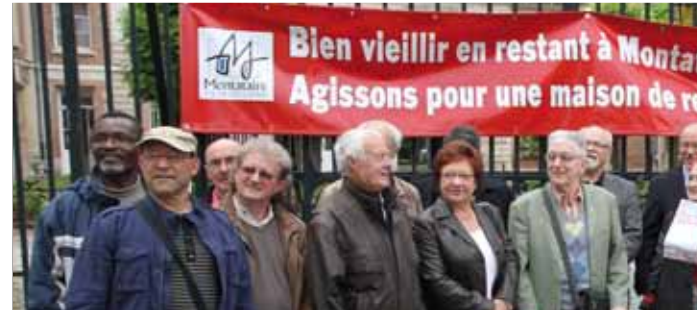
26 juin Délégation à la préfecture de l'Oise et au Conseil Général afin de défendre le projet.