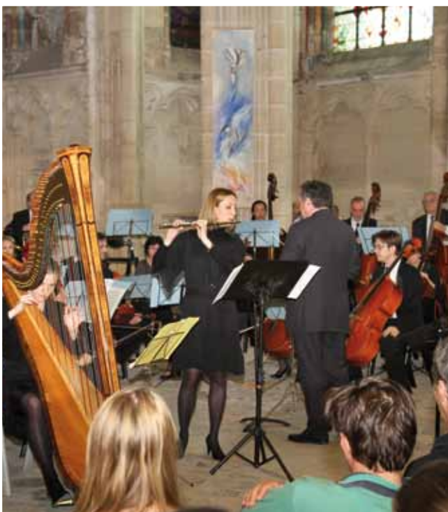
24 juin Concert classique à l'église Notre Dame par les professeurs de l'Amem.