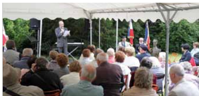
23 juin Les amis d'Henri Barbusse se sont réunis comme chaque année à Aumont.