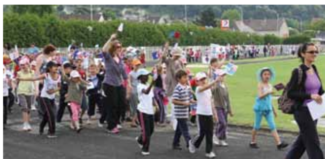
28 juin 1000 enfants sur le stade Marcel Coene.