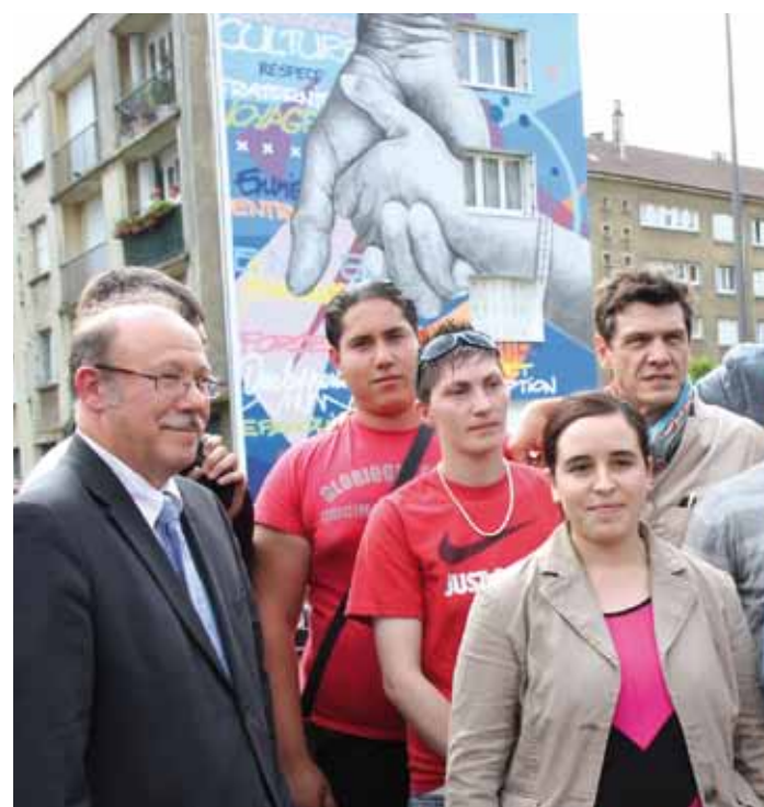
29 juin Inauguration des fresques Biondi, avec Marc Lavoine, les artistes Franck Bourgeois et Justine, associant un grand nombre de partenaires, pour l'insertion des jeunes dans le monde du travail.