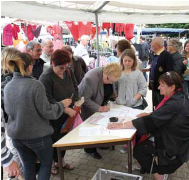
24 juin Mobilisation sur la place du marché, pour l'obtention d'un Éhpad