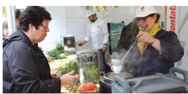
20 octobre Semaine du goût : dégustations gratuites sur le marché.