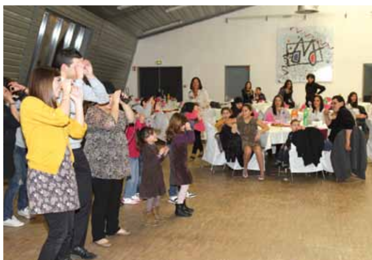
Soirée du 31 décembre à l'Espace de rencontres

Le repas pourra être pris dès 20h00, et à partir de 21h00, différentes animations commenceront comme le tirage de la tombola. Après, place à la musique, à la danse et à la fête qui doivent durer jusqu'aux premières heures de 2014. Si on ajoute les quelques surprises qui viendront rythmer la soirée, il y a fort à parier que comme l'année dernière, cette manifestation sera un succès ! ■