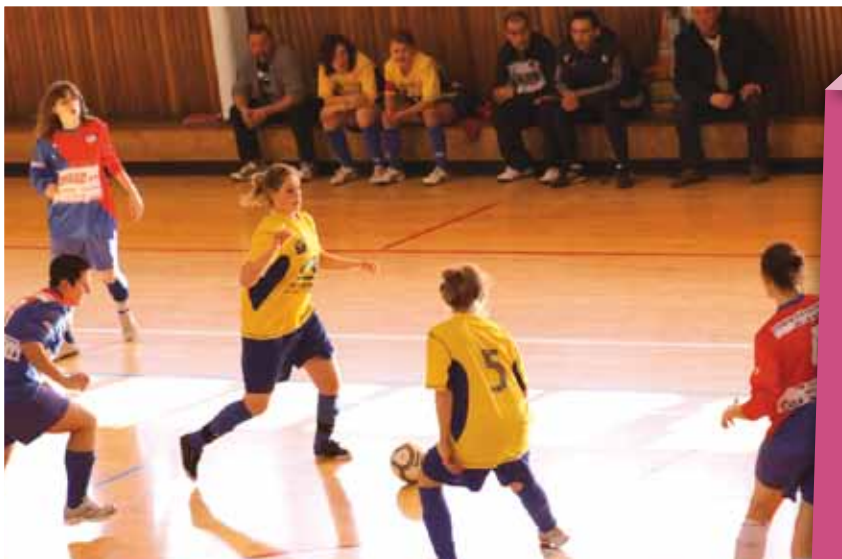
Tournoi de futsal féminin de l'année dernière