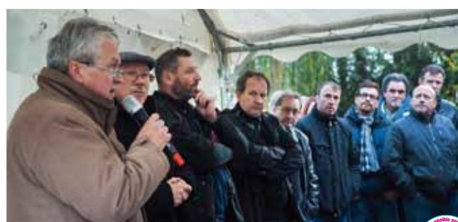
15 novembre Rassemblement pour la réindustrialisation du site Still