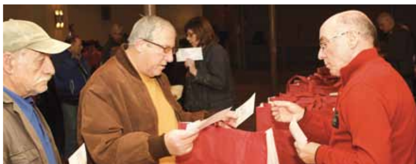
Distribution des colis de fin d'année aux retraités

retraités et des membres de la commission municipale retraités iront dans les maisons de retraite des alentours pour passer un moment avec les montatairiens résidant dans ces établissements et leur remettre également un présent. ■