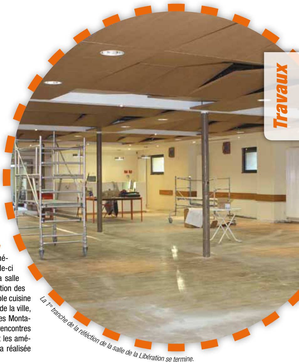
La 1 re tranche de la réfection de la salle de la Libération se termine.

La 1 re tranche de travaux prévue dans le cadre du réaménagement de la salle de la Libération est terminée. Celle-ci comprend la reprise des aménagements intérieurs de la salle (réfection du bar, de la scène, vestiaires, éclairage, réfection des sanitaires, faux-plafonds) et la mise en place d'une véritable cuisine qui permet maintenant aux associations et aux habitants de la ville, d'organiser des repas, dans des conditions optimums. Les Montatairiens et leurs associations vont retrouver la salle de rencontres historique de la ville. La 2 e tranche de travaux, regardant les aménagements extérieurs et la réalisation d'une entrée, sera réalisée l'été prochain.