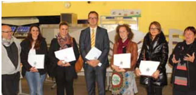
11 octobre Réception au lycée André Malraux pour les nouveaux enseignants.