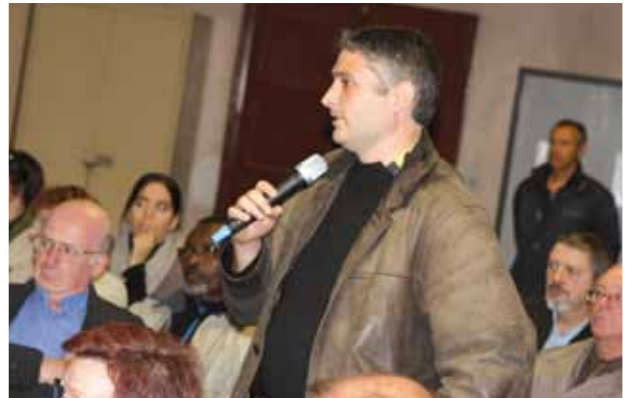
Participation des habitants à la présentation du budget