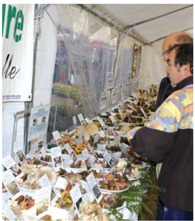
20 octobre 35 e exposition sur les champignons présentée sur la place du marché et réalisée par la Société mycologique de Montataire.