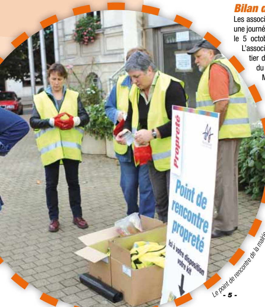
Le point de rencontre de la mairie pour la journée de la propreté

Cette action sera renouvelée l'année prochaine dans le cadre de la campagne de propreté 2014. ■