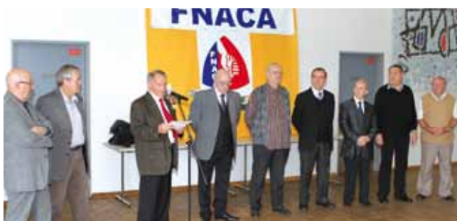
6 octobre 40 e anniversaire du comité de la fédération nationale des anciens combattants en Algérie à l'Espace de rencontres.