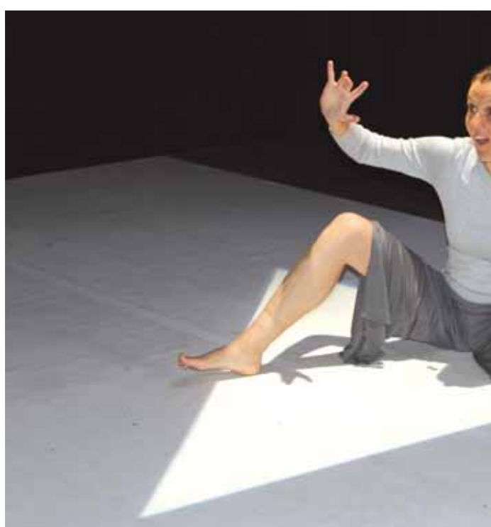
6 novembre En partenariat avec le service lecture publique de Montataire et le festival Mélancolie Motte a présenté son spectacle "Nanukuluk, l'enfant sauvage".