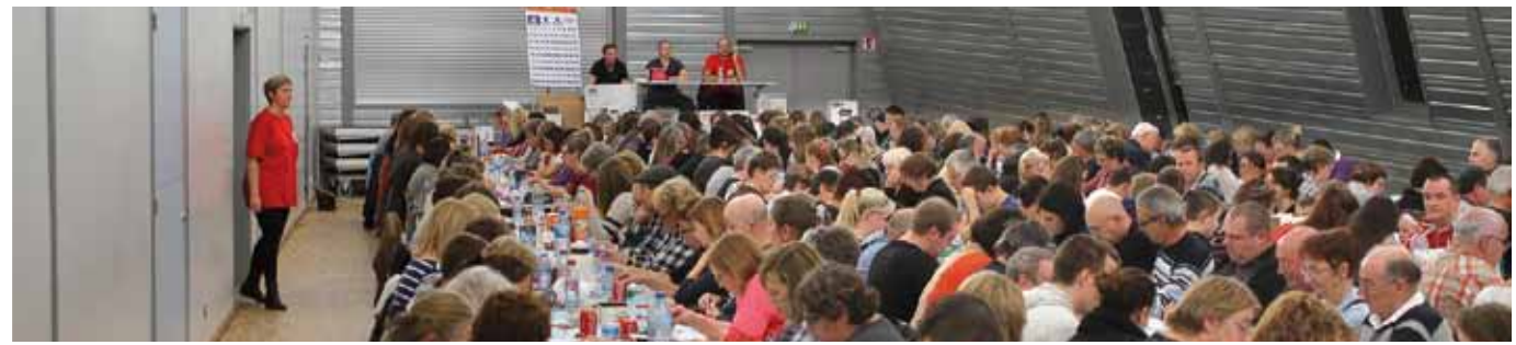
31 octobre Belle soirée à l'Espace de rencontres pour le loto organisé par le Montataire basket-ball