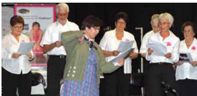
12 octobre Semaine bleue : spectacle présenté au Palace pour les retraités de notre ville "Pour votre santé, riez !"