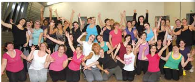
Des filles dynamiques !

Très en vogue depuis deux ans, la Zumba attire de plus en plus de pratiquants. Montataire n'échappe pas au phénomène. Reportages aux cours de Zumba dispensés dans le cadre de l'Office Municipal des Sports.