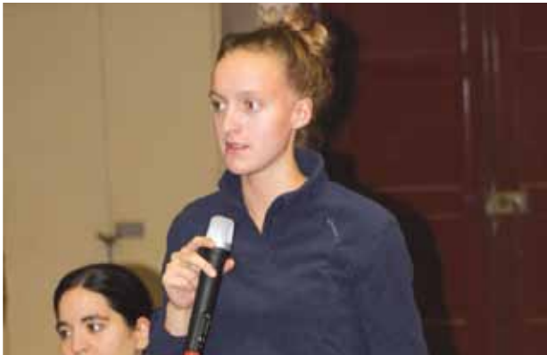
Réunion de quartier à l'école Frédéric Joliot-Curie

aux besoins réels de la population ? De façon certaine, et au delà des moyens d'action de la municipalité, il y a à interroger la production de richesses dans notre pays, de son partage et peut être d'arrêter de parler du coût du travail, tout du moins sans parler du coût du capital (intérêt, confiscation des bénéfices par les actionnaires, friabilité des investissements productifs...). ■