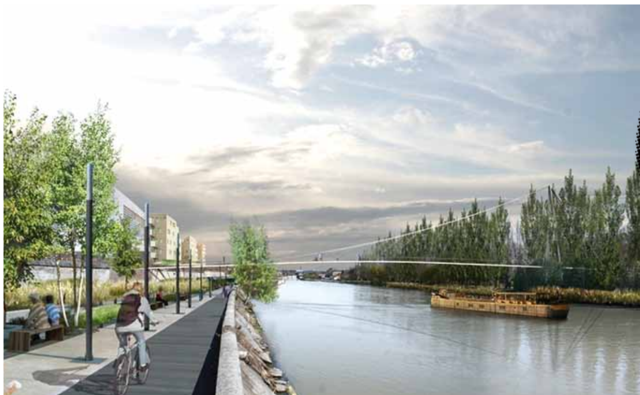
La future passerelle le long des voies ferrées avec une circulation douce pour piétons et vélos.

L'aménagement du carrefour des Forges à l'entrée de Montataire avec des itinéraires pour piétons et vélos dans un cadre paysager totalement remodelé qui a été inauguré en juin, ainsi que la requalification du pont Y intègrent là aussi des déplacements doux. Aménager les rives, penser à un urbanisme qui concilie l'activité économique et l'environnement, tout cela devrait attirer des entreprises et des ressources pour de nouvelles réalisations. ■