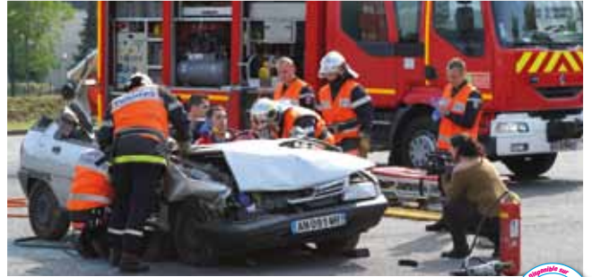
25 mai Journée sur la sécurité routière, parking Ambroise Croizat