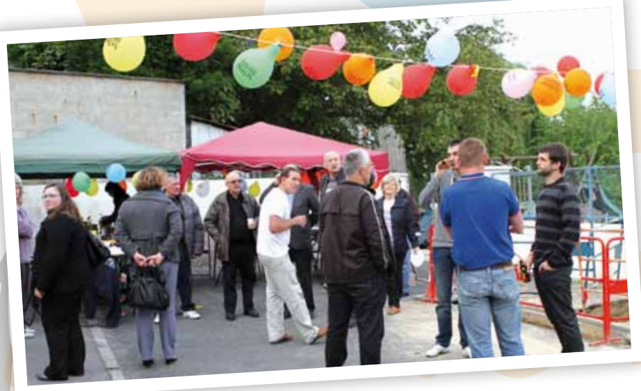
Rue Christian Cognard