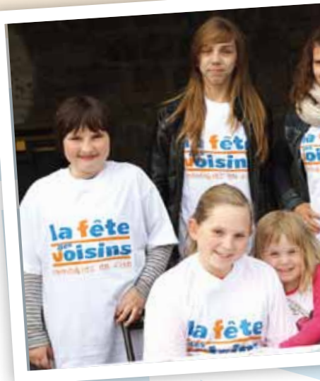
Rue Jacques Duclos