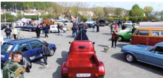
28 avril L'Association montatairienne des véhicules anciens a fêté ses 10 ans.