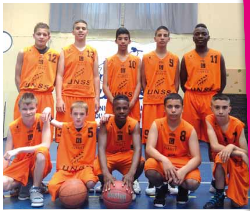
L'équipe de basket-ball minime garçons

Les équipes minimes garçons et minimes filles de basket-ball du collège Anatole France de Montataire ont participé aux championnats de France de basket-ball organisés par l'Union Nationale du Sport Scolaire (UNSS), début juin à Paris.