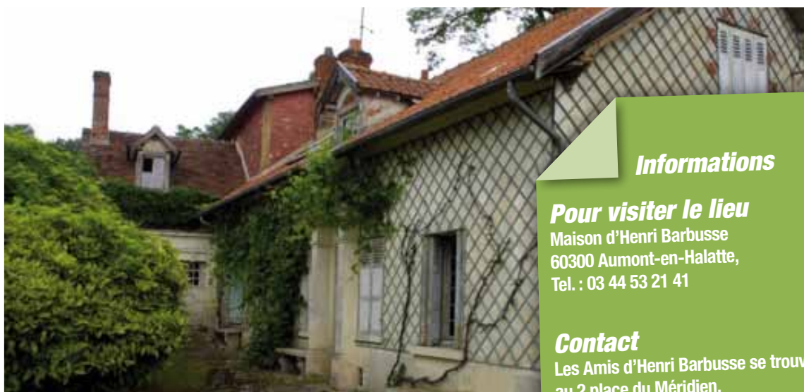
La maison Henri Barbusse à Aumont

En 1917, l'écrivain combattant participe à la fondation de l'Association Républicaine des Anciens Combattants (A.R.A.C.). Compagnon de route du Parti communiste français et ardent militant pacifiste, il décède à Moscou en 1935, avant d'être inhumé au cimetière du Père-Lachaise. La ville de Montataire, avec d'autres collectivités, a toujours soutenu les associations engagées pour faire vivre la mémoire d'Henri Barbusse. Encore aujourd'hui, ses membres se donnent rendez-vous, chaque 15 juin, à la Maison Sylvie, à Aumont-en-Halatte. ■