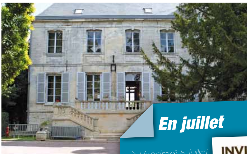
L'entrée principale du château

En mettant à la disposition des entreprises du bassin creillois le château de Montataire