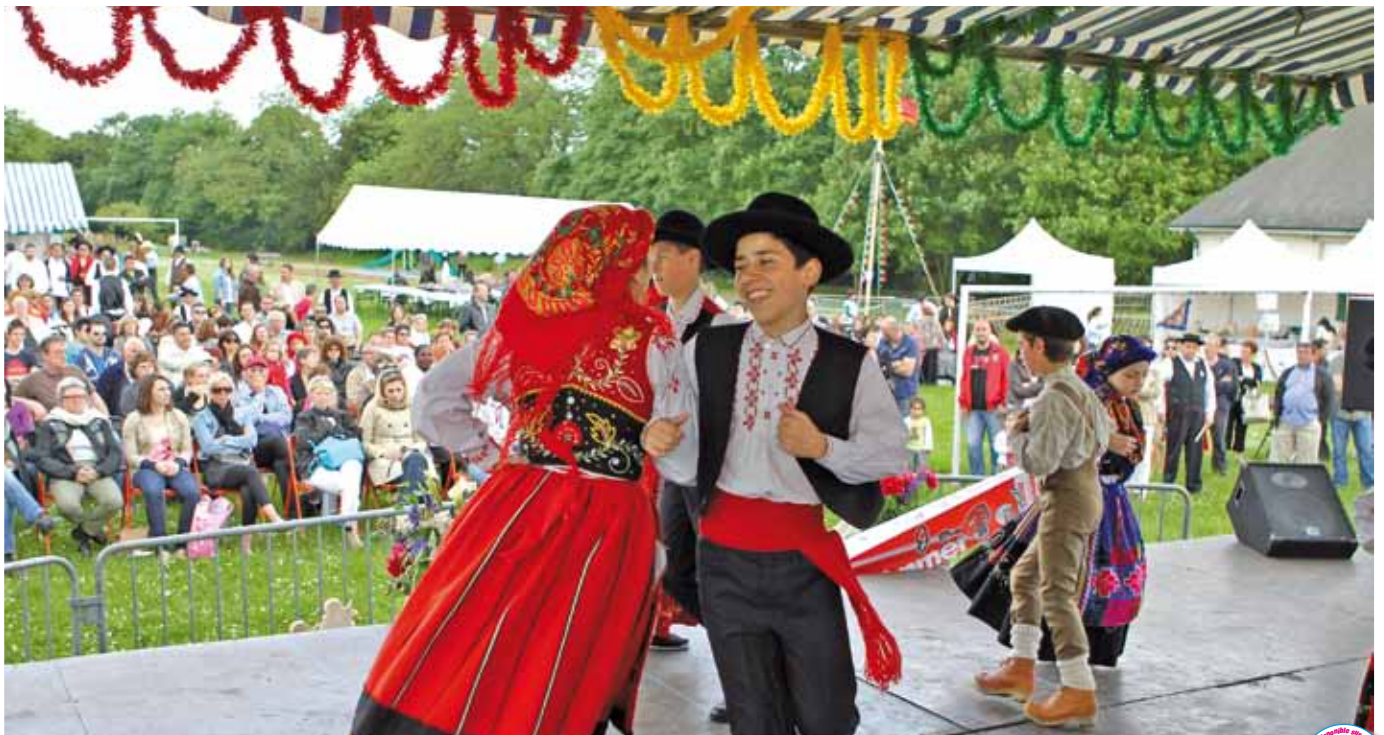
2 juin Festival de danses portugaises organisé par l'association "Souvenir du Portugal de Montataire"