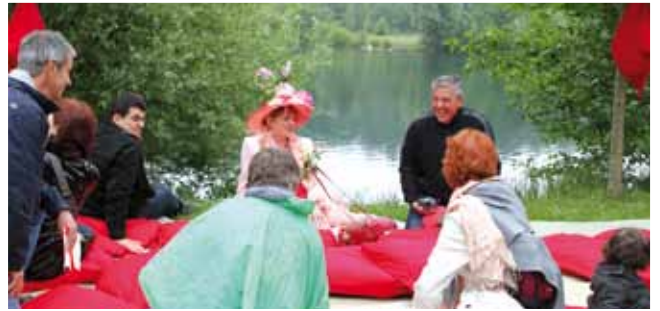
9 juin "Laissez-vous conter les parcs et jardins de l'Oise" dans le Parc du Prieuré