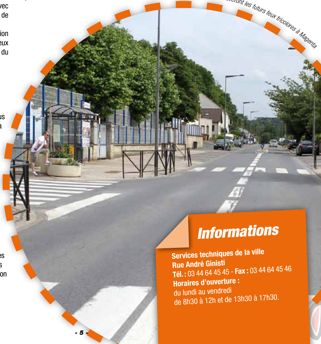
Le carrefour où se trouveront les futurs feux tricolores à Magenta