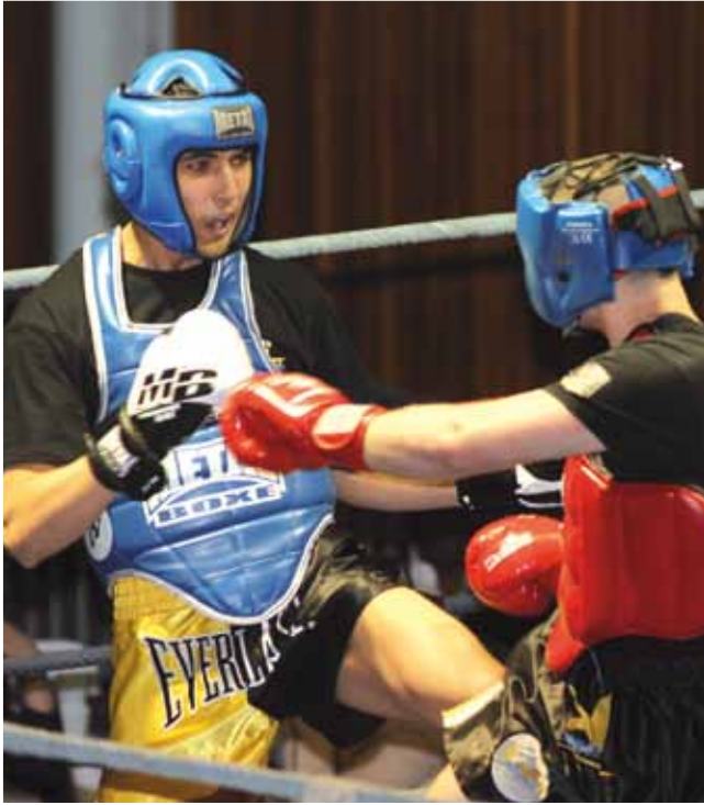
25 mai Championnat de France junior de Kick Boxing à la salle Marcel Coene