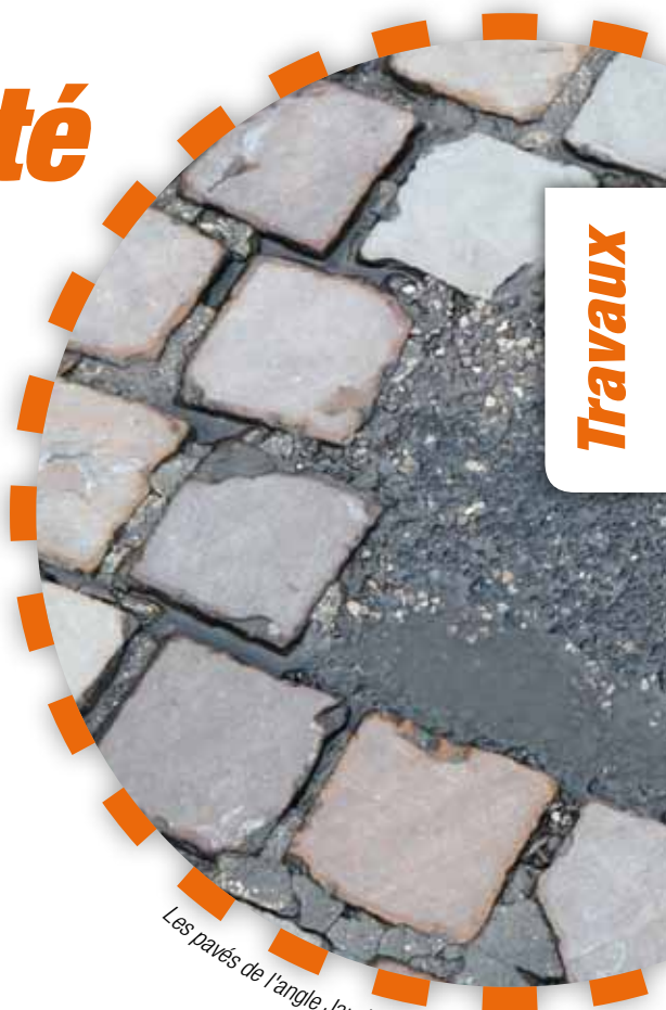
Les pavés de l'angle Jaurès / République