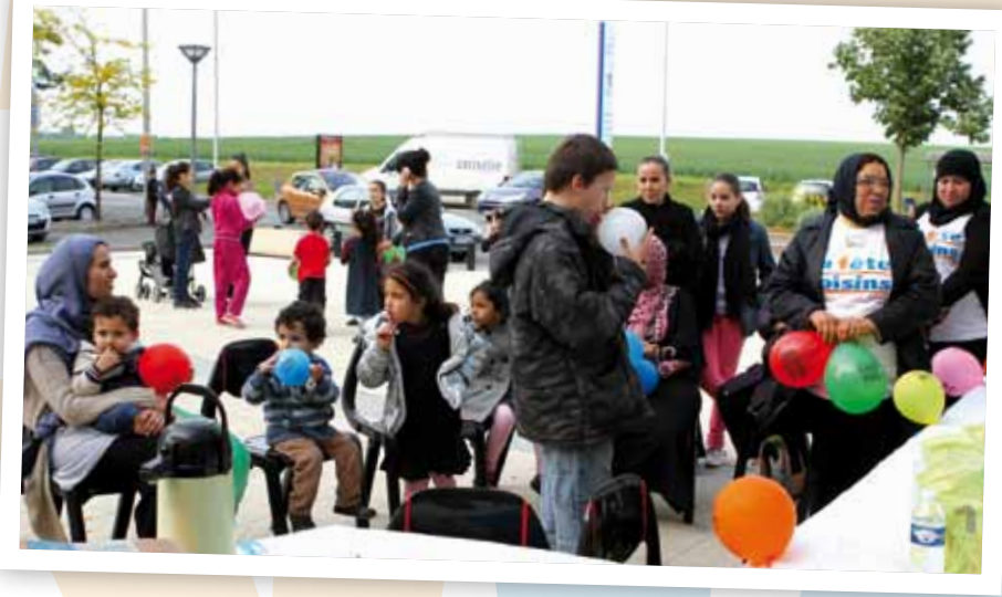
Centre commercial des Martinets